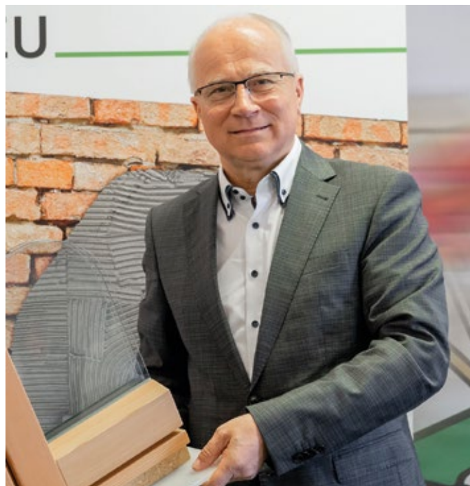
Wohnbaulandesrat Hans Seitinger: Sanierungen leisten auch einen wertvollen Beitrag zum Klimaschutz.

Das neue Maßnahmenbündel reicht von der Verbesserung der thermischen Qualität der Gebäudehülle über die Umstellung bestehender Heizungs- und Warmwasserbereitungsanlagen auf alternative Energieformen bis zur barrierefreien Gestaltung von Bestandswohnungen. Durch die Förderung der umfassenden Sanierung und Assanierung werden in den steirischen Ortszentren attraktive und leistbare Woh-